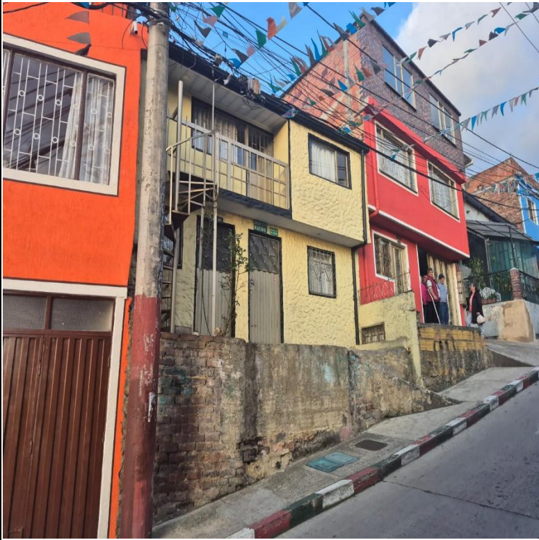
IMAGEN 3: FACHADA LATERAL